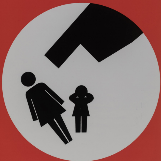
Cartel de Jorge Oteiza para una campaña pacifista tras el asesinato de Yoyes (1986).

Apunta tus respuestas a estas preguntas en un folio y luego participa en el debate que dirigirá el profesor en el aula.