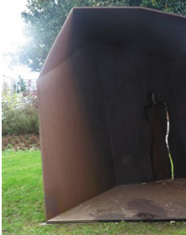
La casa de Joseba. Escultura de Agustín Ibarrola en Andoain. https://www.andoain.eus/es/esculturas-murales

Agustín Ibarrola es seguramente el artista vasco que más ha trabajado por la memoria de las víctimas del terrorismo. Su compromiso cívico lo llevó a enfrentarse a dos movimientos totalitarios consecutivos. Primero fue un activo antifranquista: la dictadura lo encarceló por su militancia en el Partido Comunista de España (PCE). Después se convirtió en un símbolo de la resistencia contra ETA. Fue uno de los fundadores de la iniciativa ciudadana Basta Ya (1999). Agustín Ibarrola creó numerosos monumentos públicos de homenaje a las víctimas. Se pueden contemplar tanto en el País Vasco (Ermua, Vitoria o Andoain) como el resto de España (Logroño, Alicante o Santander).