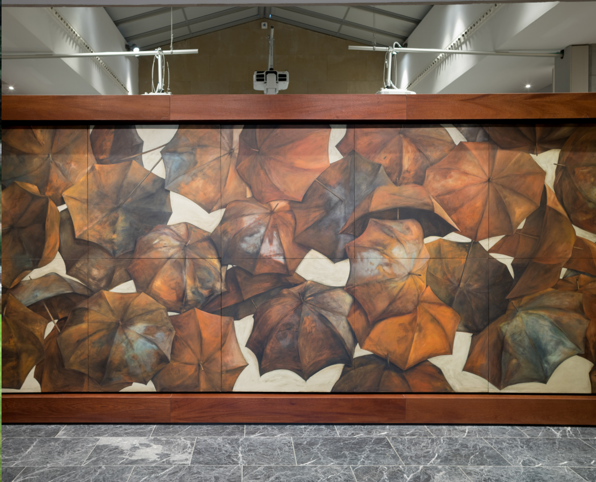
José Ibarrola: Memoria. Óleo sobre tabla. Centro Memorial de las Víctimas del Terrorismo.

quedaron juntos, huérfanos, en el límite de un charco rojo y espeso. El paraguas abierto en el suelo y balanceándose a merced de un viento implacable, presagia la ausencia definitiva de quien yace junto a él”.