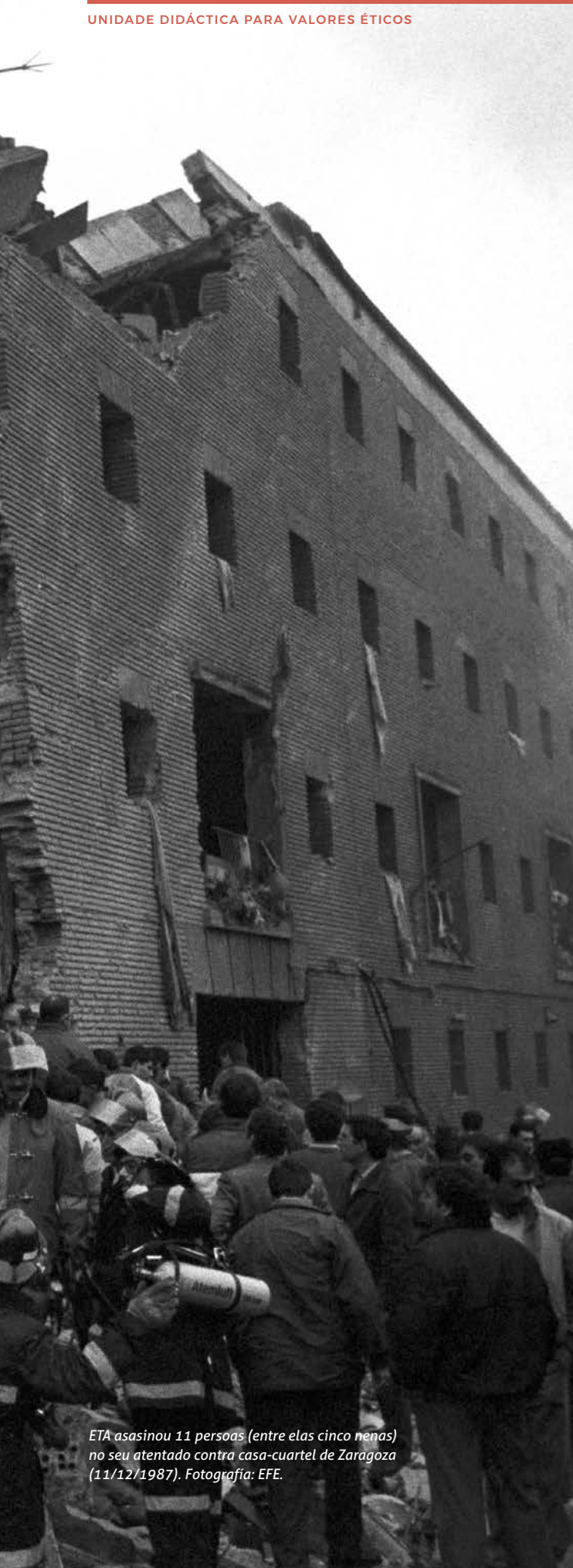
ETA asasinou 11 persoas (entre elas cinco nenas) no seu atentado contra casa-cuartel de Zaragoza (11/12/1987).