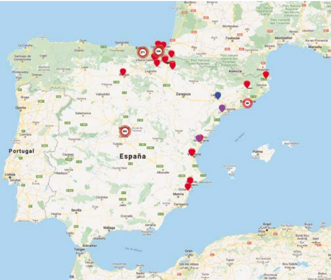
Mapa do terror de Covite: https://mapadelterror.com

Lamentablemente esta vulneración dos dereitos humanos ocorre en boa parte do mundo e tamén moi preto de ti. Hai un dato arrepiante: só en España, case 1.500 persoas perderon a vida como consecuencia de actos terroristas desde 1960.