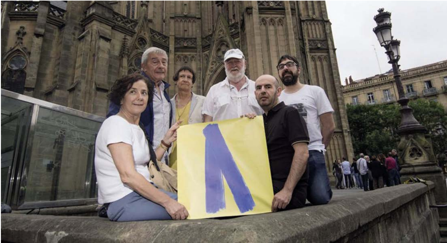
Imaxe da reportaxe El secuestro que desató el lazo azul (O secuestro que desatou o lazo azul) .