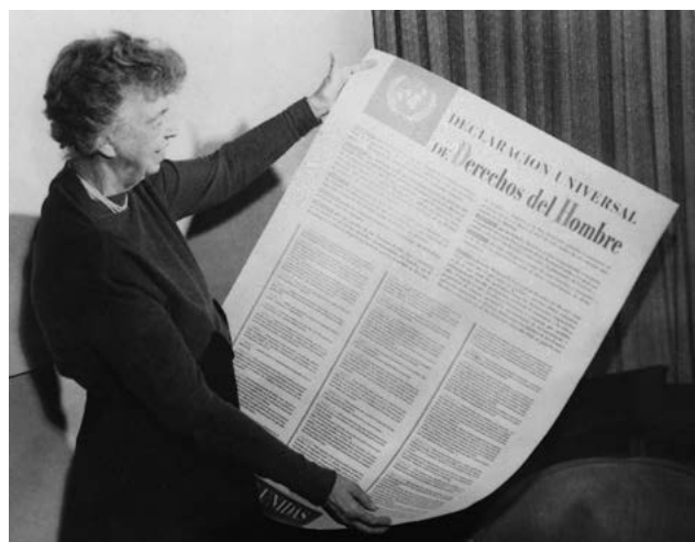
Eleanor Roosevelt coa DUDH en español. Novembro 1949.