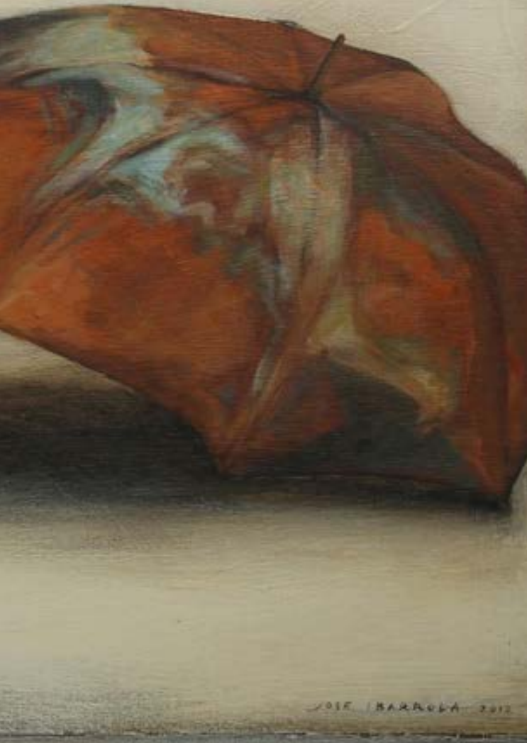
Quedarán en la memoria (2012). José Ibarrolaren margoa.