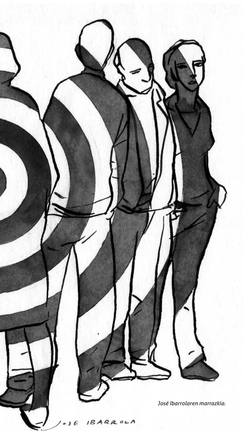
José Ibarrolaren marrazkia.

baituzu: giza eskubideen urraketen biktimak (eta horiek definitzen dute, hain zuzen ere, gure giza izaera). Oso garrantzitsuak dira eskuratutako ezagutzak, zure emozioen eta sentimenduen azterketa, giza eskubideen urraketan (zehazki, terrorismoarenak) biktimen aurrean egiten dugunari buruzko hausnarketa, bai eta haien egindako oroimen, justizia, egia eta erreparazioaren eskaera ere.