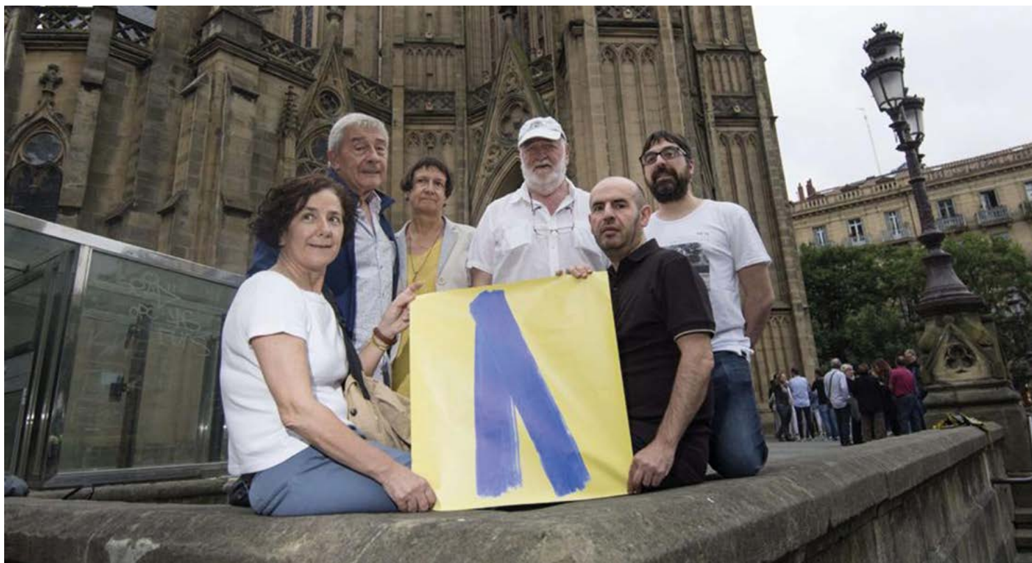
Erreportajearen irudia Lazo urdina piztu zuen bahiketa