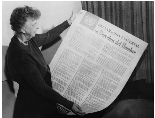
Eleanor Roosevelt, Giza Eskubideen Aldarrikapen Unibertsalaren gaztelaniazko bertsioarekin. 1949ko azaroa.