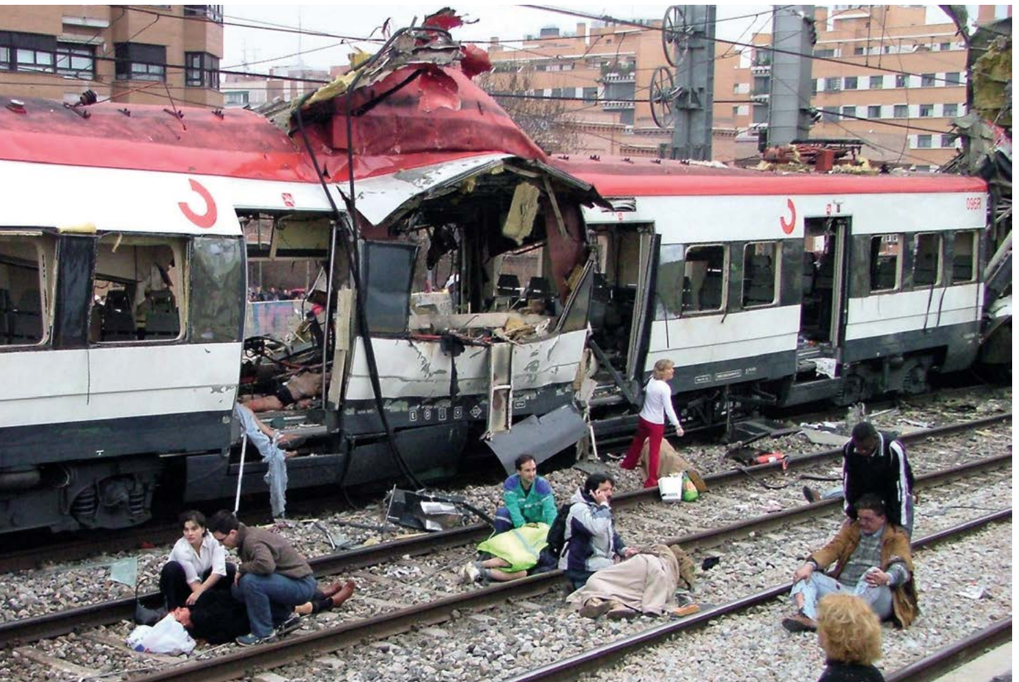
Víctimas del atentado del 11-M de 2004 recibiendo ayuda.