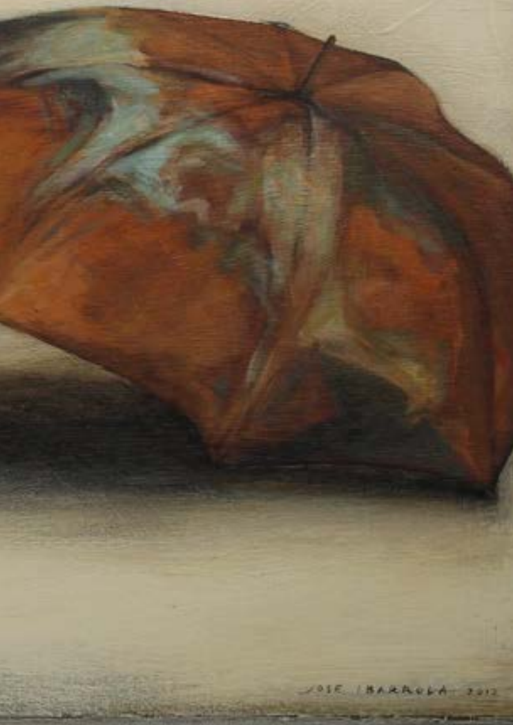
Quedarán en la memoria (2012). Pintura de José Ibarrola.